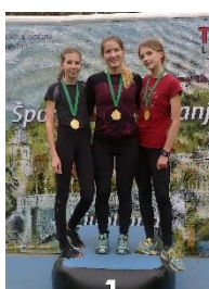
Ines in Ana