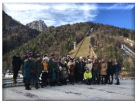
Ogledali smo si Nordijski center Planica.