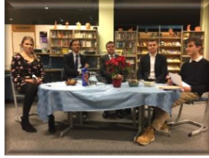
Organizirali okroglo mizo na temo Diplomacija v 21. stoletju