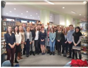
Obiskali nemško veleposlaništvo, Institut za italijansko kulturo in sprejeli na šoli poljskega veleposlanika z ženo.