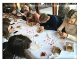
Izdelovali lect v gostilni Lectar v Radovljici.