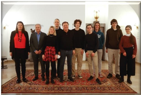
Mestna občina Ljubljana, foto Nik Rovan