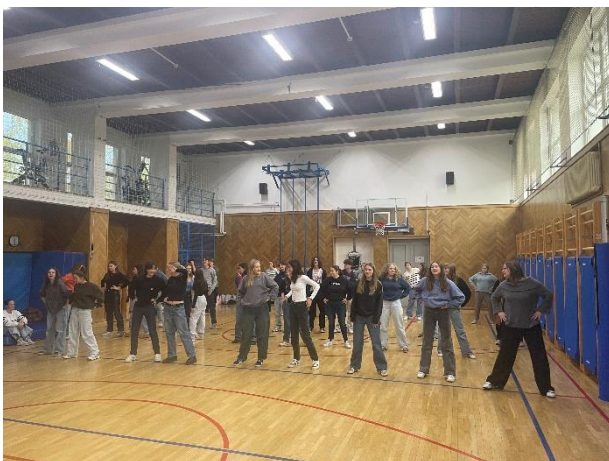
Delavnica učenja tradicionalnih slovenskih plesov