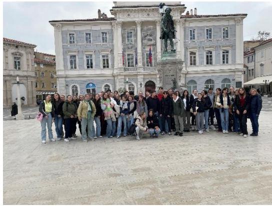
Ogled morskih mest Kopra in Pirana