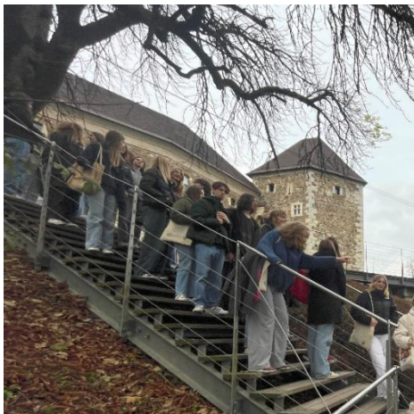
Obisk Ljubljanskega gradu

Najlepši del izkušnje je bilo spoznavanje novih prijateljev. Povezali smo se skozi izmenjavo idej, skupnega dela in odkrivanja novih krajev. Ob koncu izmenjave smo bili bolj kot le skupina dijakov, postali smo prava ekipa, ki je ustvarila nepozabne spomine in vzpostavila trajne vezi. Ta izkušnja nam je resnično razširila naš pogled na svet. Obisk vračamo v mesecu marcu 2024.