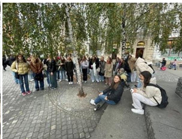
Pred Prešernovim spomenikom v Ljubljani