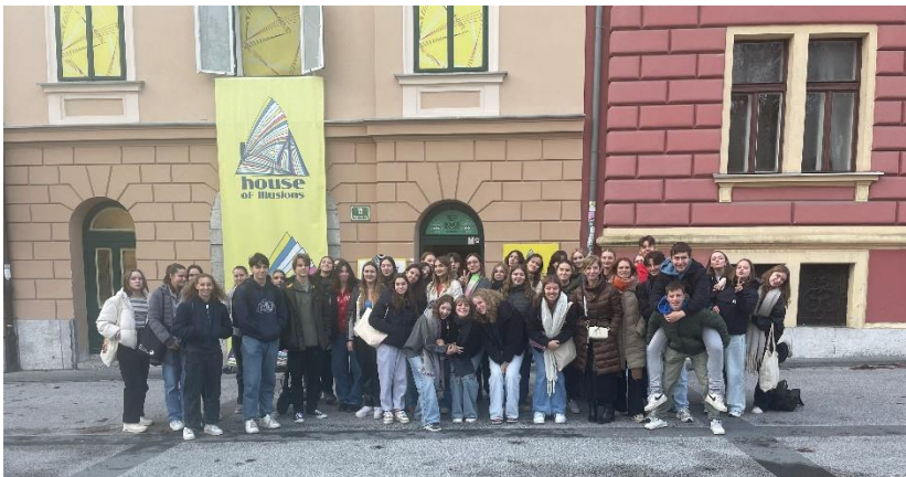
Pred Hišo iluzij