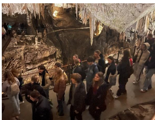
Obisk Postojnske jama